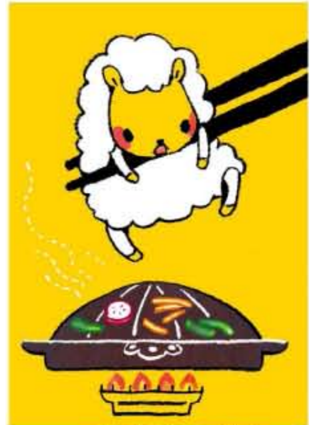
ジンギスカンのジコちゃん