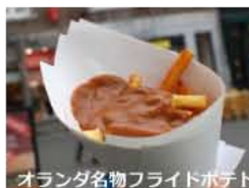
オランダ名物フライドポテト