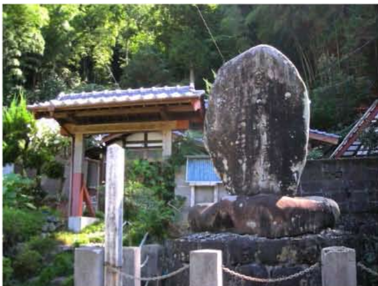
3 宮野々番所跡:伊予までの土佐藩の関所 これを越えると龍馬は後戻りできない

遅れましたが、3月には10期生諸君、ご卒業おめでとうございます。4月には新入生の諸君、ご入学おめでとうございます。歴史ツーリングをとおして歴史を知ろう【ペンネーム史郎】です。よろしくお祈りします。