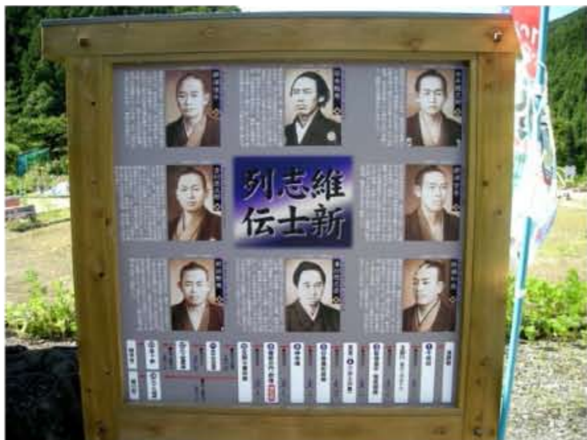
3 土佐維新志士列伝の人物案内【梶原町】

幕府はキリスト教を恐れて鎖国化したが【オランダはプロテスタント】、西日本から江戸・東日本へ伝播する感染症はまったく防げなかった。15世紀中頃～17世紀の大航海時代、スペイン・ポルトガルなどの植民地化はキリスト教がまず布教して宣教師の保護で軍隊が駐屯する手段は江戸幕府も知っていました。