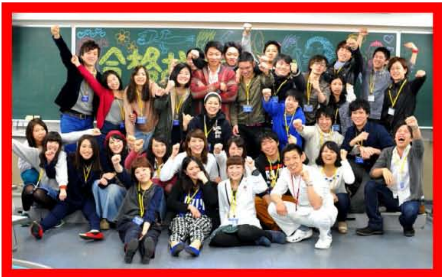
そして、ブービー賞 タカス〜クリニック♪