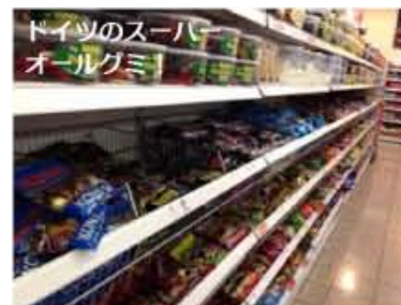
ドイツのスーパー オールグミ