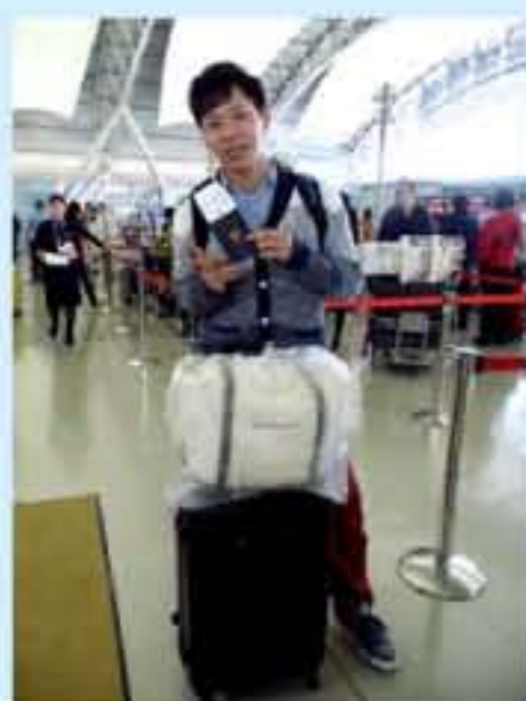
いまから 搭乗手続き... China