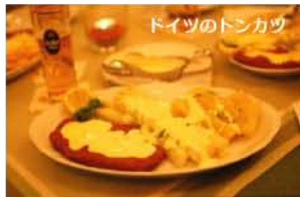
ドイツのトンカツ

あるいは、おなじものでも値段が高ければまいち、格安ならおいしく感じることもあるだろうし【高ければおいしいという人も…】、同席する面子も大きく関係するだろう。というわけで、一個人の小さな体験のみでその地域全体の料理を語るのはいかがかと思うこともある。